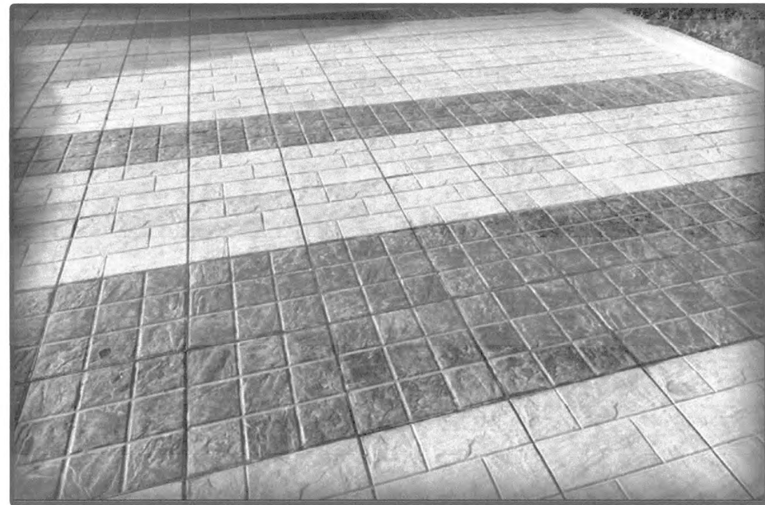
รูปแบบพื้นคอนกรีตพิมพ์ลาย (Stamp Concrete)